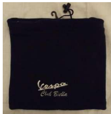
Fascia Scaldacollo/ Berretto