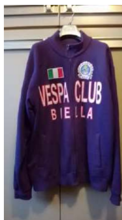
Felpa ricamata "Classic"