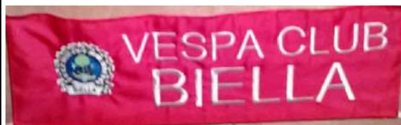
Fascia da scudo Ricamata