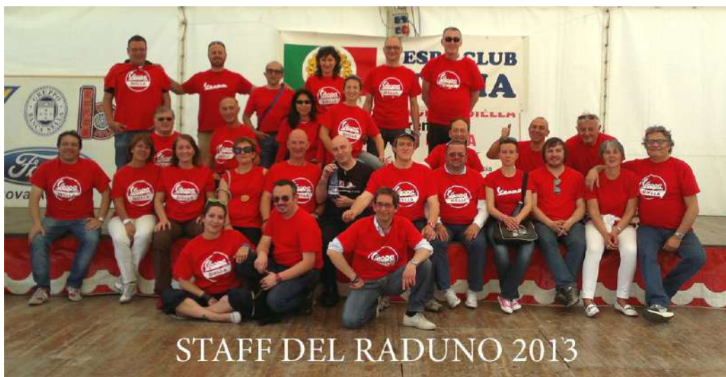
STAFF DEL RADUNO 2013